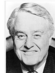
Sargent Shriver 1915 - 2011