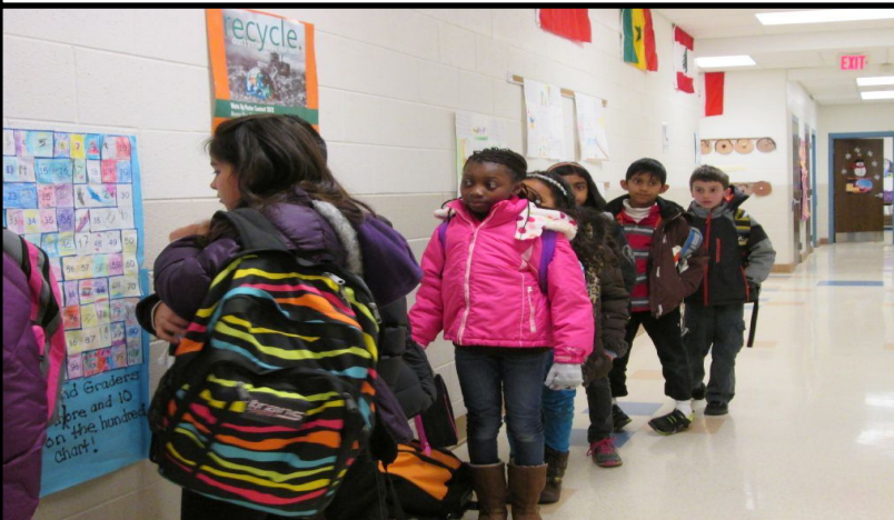
After the bell rings, students stand up to go into the classroom. Después de que suena el timbre, los estudiantes se ponen de pie y van a sus aulas.