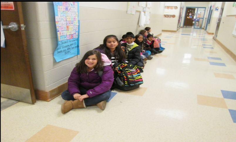
Students talk with their classroom friends. Estudiantes hablan con sus compañeros de clase. 學生和同學交談。