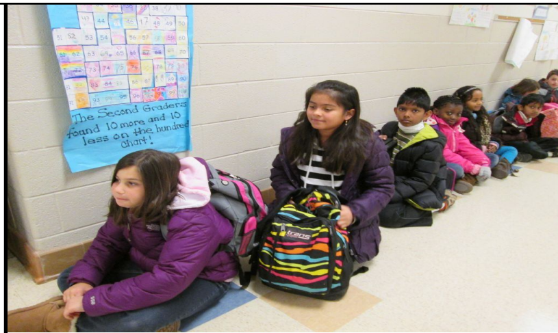
Students sit outside their classroom until the bell rings. Estudiantes se sientan afuera de sus aulas hasta que suene el timbre. 學生坐在教室外，直到響上課鈴為止。