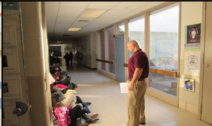
Teachers monitor the halls to keep children safe. Maestros supervisan los pasillos para que los niños estén seguros. 老師們監督走廊，確保學生的安全。