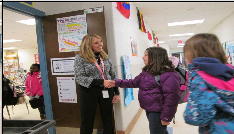
Our teachers greet each student as they walk into the classroom. Nuestros maestros saludan a cada estudiante al entrar al aula.