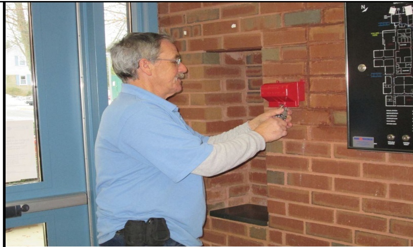
We are preparing for a Fire Drill. Nos estamos preparando para un Simulacro de Incendio. 我們正在準備消防演習。