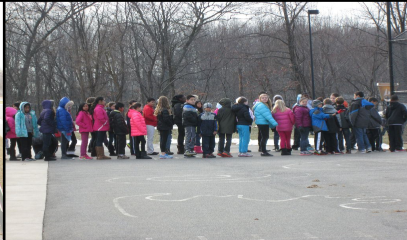
Students and teachers line-up facing away from the building. Los estudiantes y los maestros forman fila de espaldas al edificio. 學生和教師背對校舍排隊。