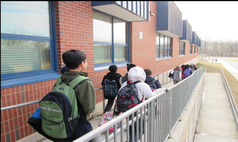
Students exiting the building for a Fire Drill. Los estudiantes salen del edificio para el Simulacro de Incendio. 學生在消防演習時撤離校舍。