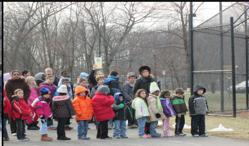
We practice a Fire Drill once a month. Tenemos práctica de Simulacro de Incendio una vez al mes.