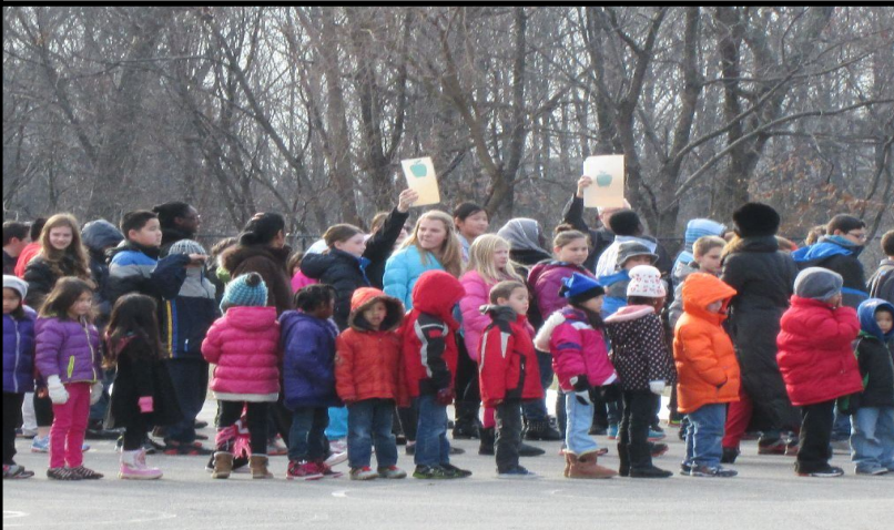
Teachers take attendance to make sure everyone is safe. Los maestros toman asistencia para asegurarse que todos estén a salvo.