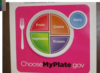
Eat a balanced diet! ¡Consume alimentos para una dieta balanceada! 平衡膳食!