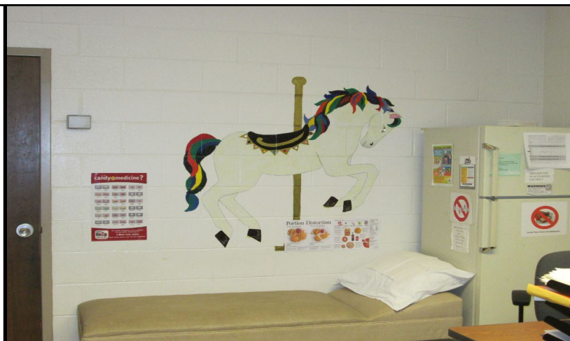
A view of the Health Room Una vista de la Enfermería Escolar 醫務室一景