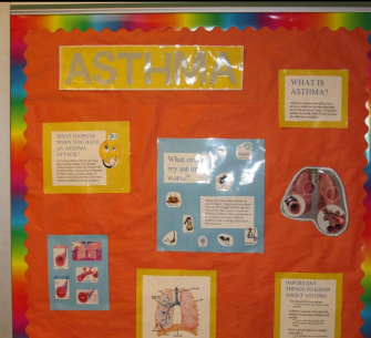
When you are in the Health Room, learn about staying healthy. Cuando estés en la Enfermería Escolar, aprende cómo mantenerte saludable. 你在醫務室時，還可以了解如何保 持健康。