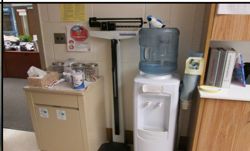
The Health Room can measure how tall you are and how much you weigh. La Enfermería Escolar puede medir tu altura y cuánto pesas. 醫務室可以為你測量身高和體重。