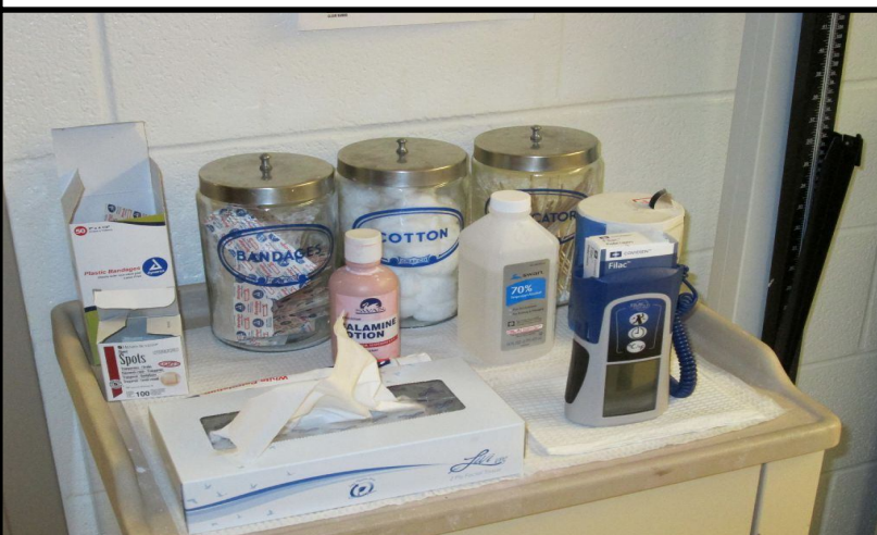
Bandages are very popular with our students. Las bandas adhesivas son muy populares entre nuestros estudiantes. 創可貼很受學生歡迎。